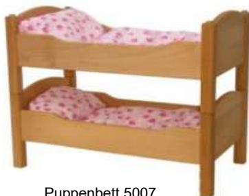
Puppenbett 5007 Puppen-Etagenbett 5012